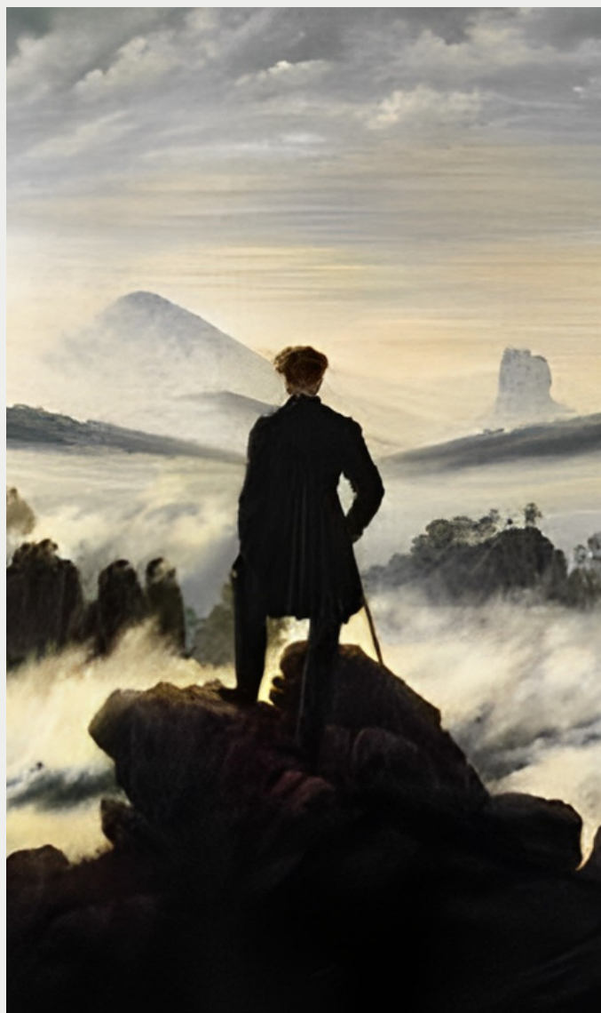
Caspar David Friedrich, Οδοιπόρος επάνω από τη θάλασσα της ομίχλης, 1818.

Ο κοινωνικός άνθρωπος πρέπει να κατανοήσει τους μηχανισμούς των μεταβολών και τη λογική τους, ειδάλλως θα διαβιεί παρασυρόμενος από τα γεγονότα και βρισκόμενος διαρκώς μπροστά σε εκπλήξεις, σαν να μην μπορεί ποτέ να επηρεάσει την τύχη του: το πρόσωπο και η ζωή του αλλάζουν και εκείνος το διαπιστώνει εκ των υστέρων, έκπληκτος.