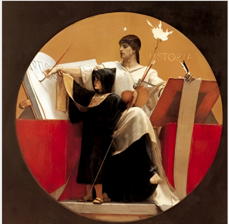
Νικόλαος Γύζης, Η Ιστορία, 1892, Λάδι σε μουσαμά.

Με την αποκατάσταση της δημοκρατίας σηματοδοτήθηκε ένα νέο θεσμικό πλαίσιο λειτουργίας της πανεπιστημιακής