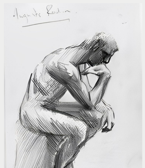
Άγνωστου καλλιτέχνη, Σχέδιο με θέμα το γλυπτό Ο Σκεπτόμενος, του Auguste Rodin.

Η αναδίφηση στο παρελθόν, στην «κιβωτό των διαχρονικών αξιών», ερείδεται στην αμφιταλάντευση, την απουσία νοήματος και την αίσθηση οριακότητας του σύγχρονου ανθρώπου