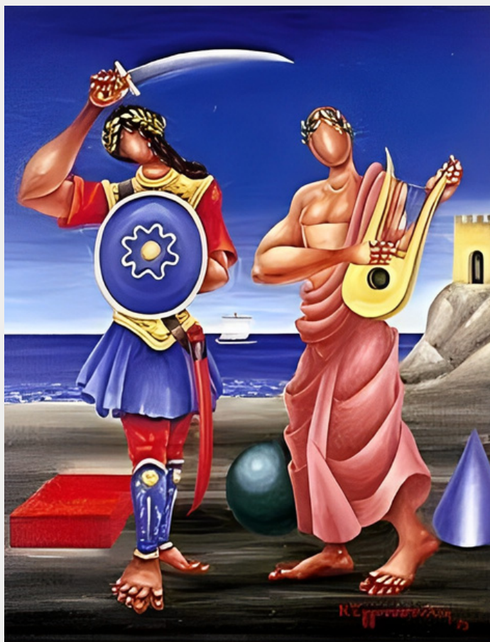
Νίκος Εγγονόπουλος, Ποιητής και Ηρωας, 1973, Λάδι σε καμβά.

στη διαμόρφωση της κοινωνικής και πολιτικής πράξης. Μέσα από αυτή την κοινωνική διεργασία αναφανδόν προκύπτει το ερώτημα: Τι είδους ιστορία θέλουμε;