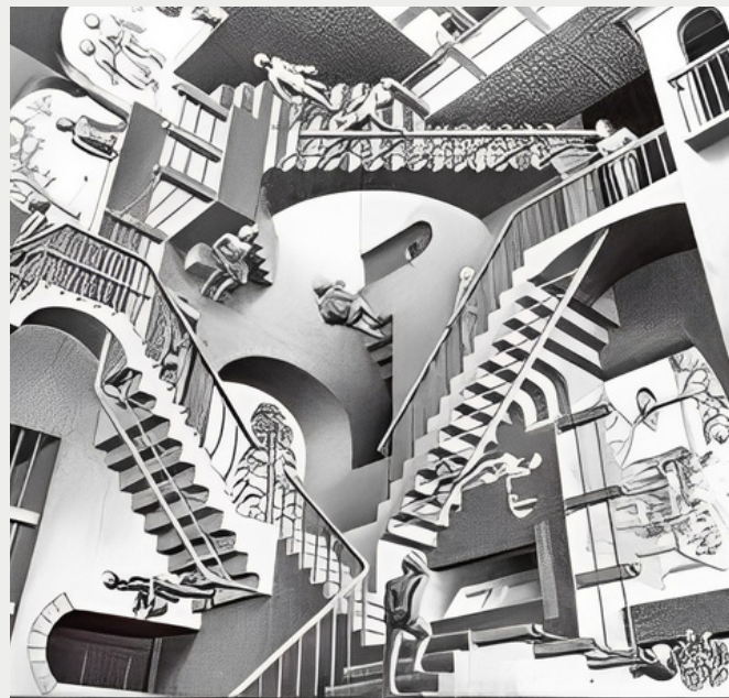
M.C.Escher, Σχετικότητα, 1953, Λιθογραφία.

Η δυναμική του ιστορικού λόγου να συνδιαλέγεται με τον ιδεολογικό και πολιτικό λόγο καθιστά την ιστορία «πολύ σοβαρή υπόθεση», διότι συντελεί, και με μεγάλη εμβέλεια,